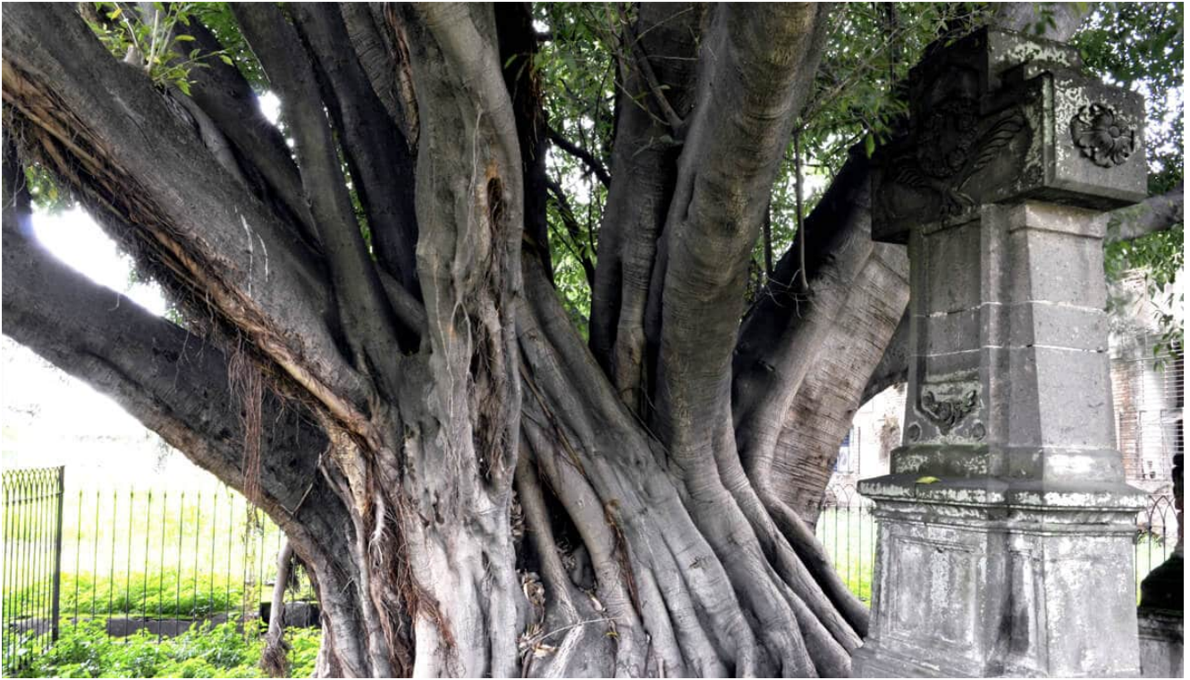
leyenda árbol del vampiro