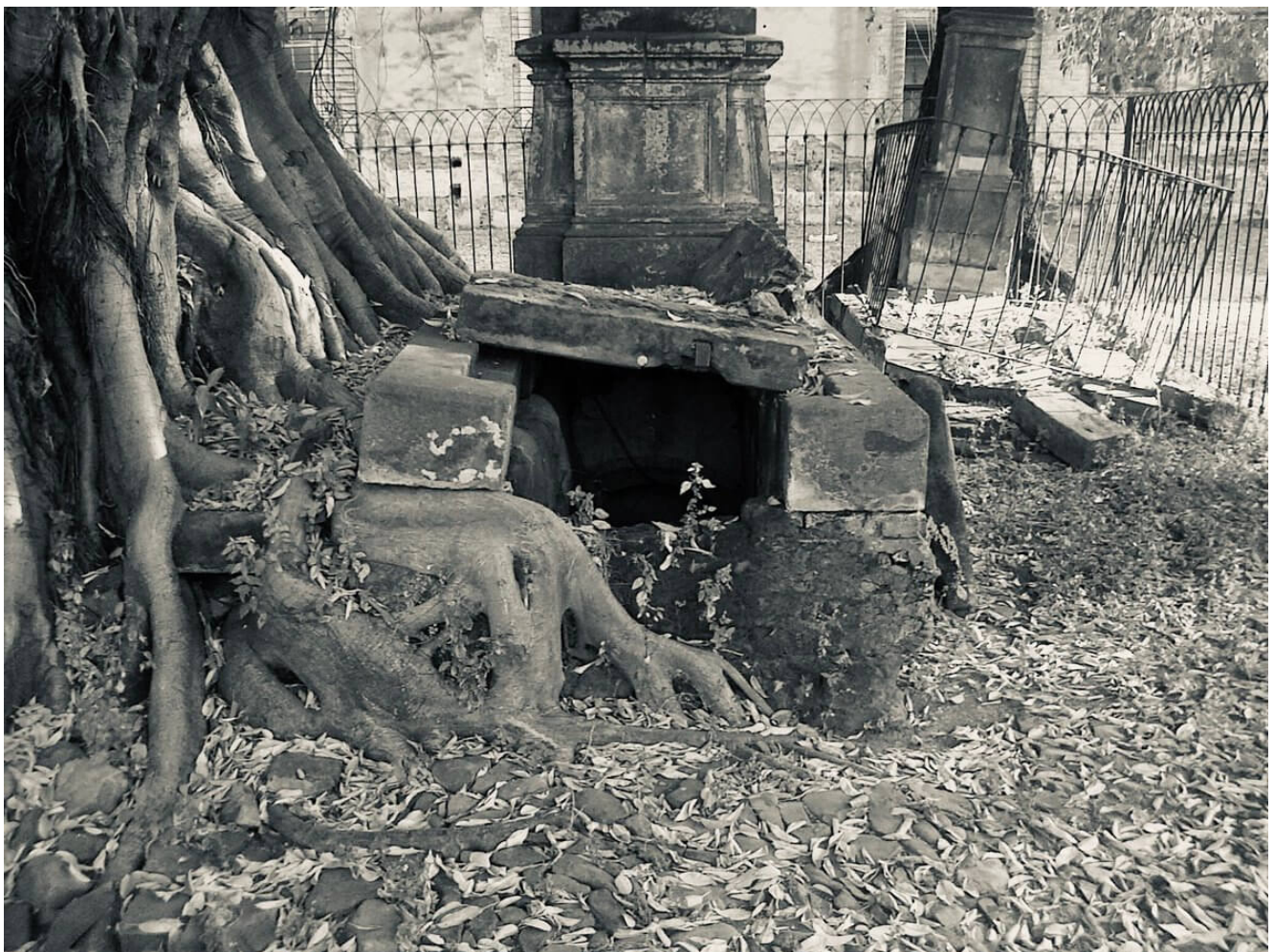
tumba árbol del vampiro