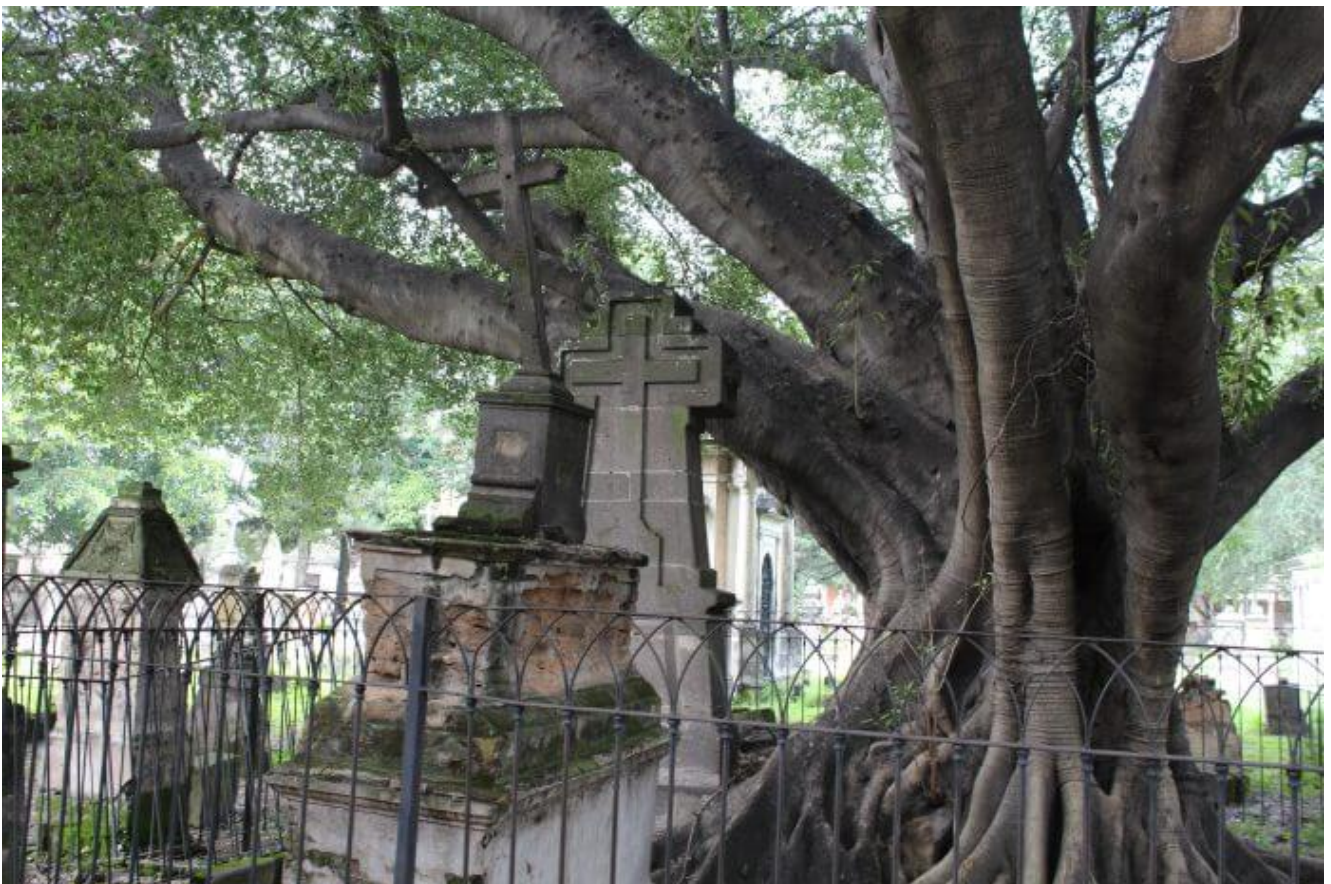
árbol del Vampiro del Panteón del Belén