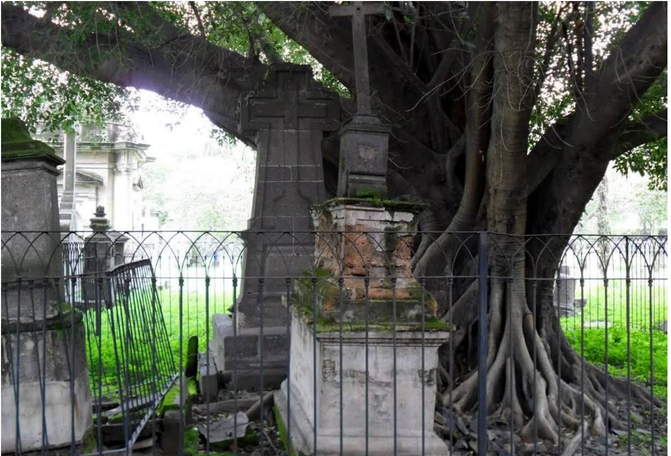
árbol vampiro Guadalajara